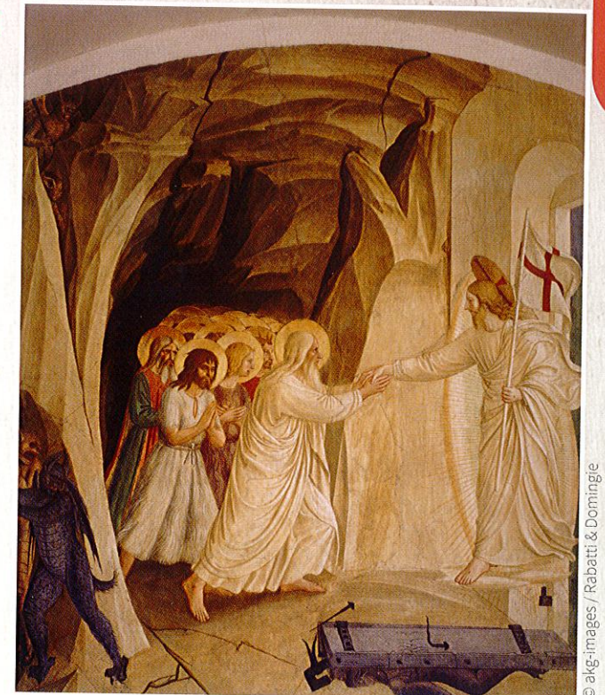
La descente aux limbes, détail de la face arrière du retable La Maestà, Duccio di Buoninsegna, 1308, musée de l'œuvre du Dôme, Sienne, Italie.

A près le sabbat, à l'heure où commençait à poindre le premier jour de la semaine, Marie Madeleine et l'autre Marie vinrent pour regarder le sépulcre. Et voilà qu'il y eut un grand tremblement de terre ; l'ange du Seigneur descendit du ciel, vint rouler la pierre et s'assit dessus. Il avait l'aspect de l'éclair, et son vêtement était blanc comme neige. Les gardes, dans la crainte qu'ils éprouvèrent, se mirent à trembler et devinrent comme morts. L'ange prit la parole et dit aux femmes : « Vous, soyez sans crainte ! Je sais que vous cherchez Jésus le Crucifié. Il n'est pas ici, car il est ressuscité, comme il l'avait dit. Venez voir l'endroit où il reposait. Puis, vite, allez dire à ses disciples : "Il est ressuscité d'entre les morts, et voici qu'il vous précède en Galilée ; là, vous le verrez." Voilà ce que j'avais à vous dire. » Vite, elles quittèrent le tombeau, remplies à la fois de crainte et d'une grande joie, et elles coururent porter la nouvelle à ses disciples. Et voici que Jésus vint à leur rencontre et leur dit : « Je vous salue. » Elles s'approchèrent, lui saisirent les pieds et se prosternèrent devant lui.