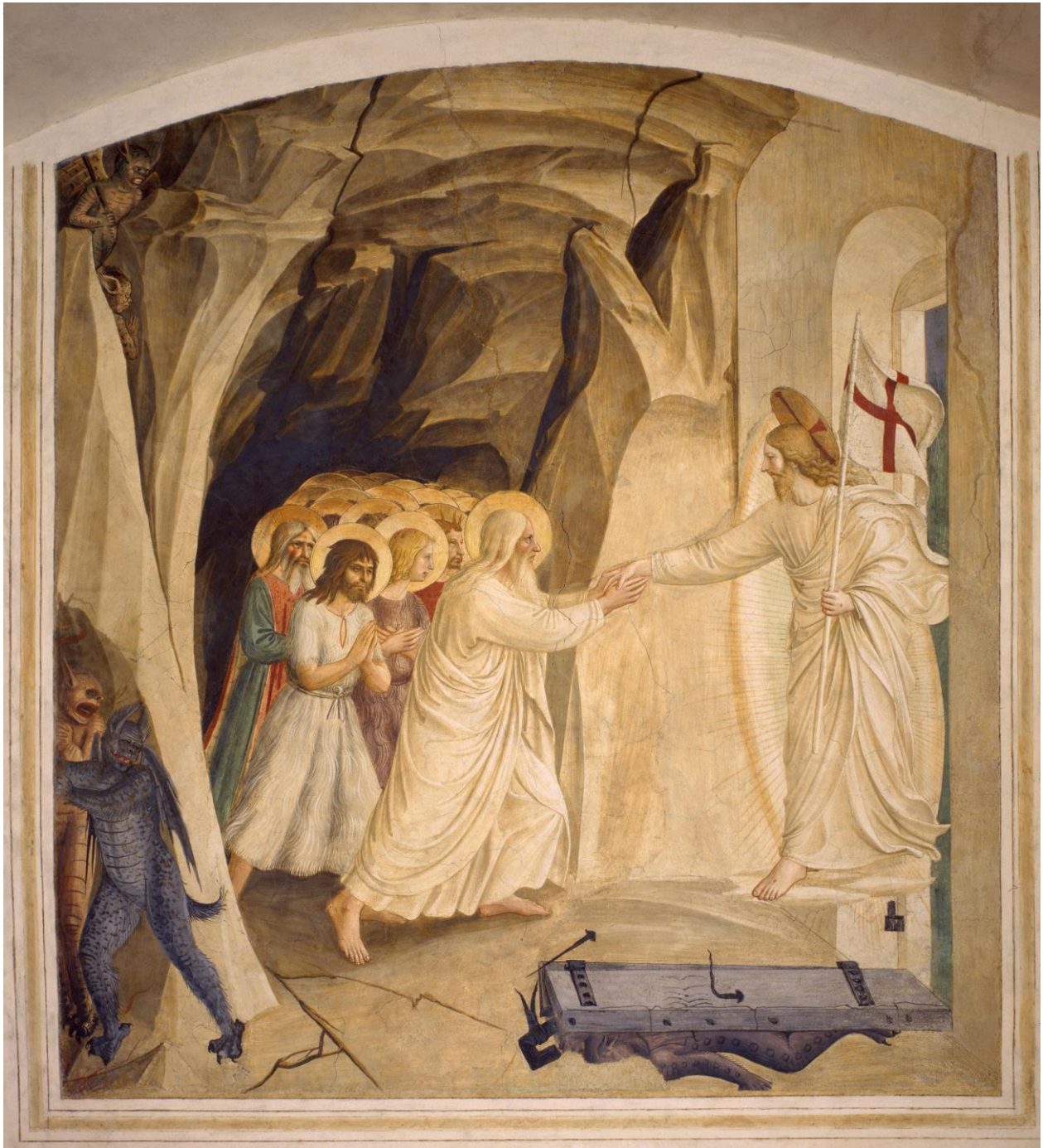
La descente aux limbes , fresque de Fra Angelico, 1441, couvent San Marco, Florence, Italie.