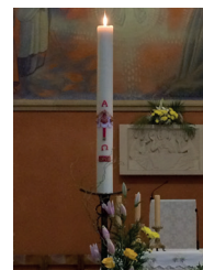
Le cierge pascal